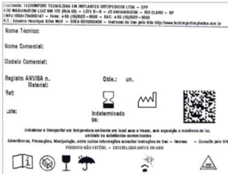
Legenda da Simbologia

O Guia Customizado é fornecido na condição não esteril, comercializado individualmente em embalagem plastica. As embalagens sao identificadas com uma etiqueta RFID conforme indicação abaixo: