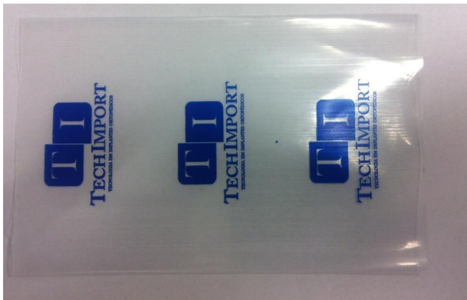
Figura 1 – Modelo da embalagem utilizada na embalagem dos parafusos

O implante é embalado unitariamente em embalagens plásticas transparente fabricadas em polietileno (figura 1). Em todas as embalagens são inseridas as instruções de uso do produto. Cada parafuso são embalados individualmente e rotulados. Junto com cada implante são fornecidas 6 rotulos internos que é a etiqueta de rastreabilidade. O modelo do rotulo bem como as informações contidas nelas estão definidas na figura 2.