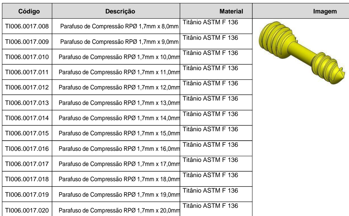
Tabela 1: Relação de Modelos Comerciais - Parafusos de Compressão Não Canulados Micro e Mini Fragmentos RP