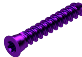
Parafuso não Bloqueado Ø3,5 mm Non-locking screw / Tornillo sin bloqueo TI002.0035.0XX - comprimento de 14,0 mm a 40,0 mm