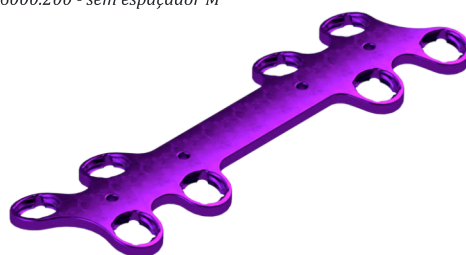
Placa de Reconstrução Bloqueada AV Sistema 3,5 Reconstruction plate / Placa de reconstrucción TI003.7000.001 - 06 Furos 37,0 mm TI003.7000.003 - 14 Furos 66,0 mm TI003.7000.002 - 08 Furos 50,0 mm