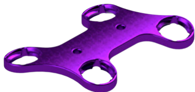
Placa Bloqueada AV Fusão Tarsal Lapidus plate / Placa Lapidus TI003.3110.0XX - comprimento de 12 mm a 22,0 mm