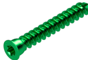
Parafuso Esponjoso não Bloqueado Ø3,5 mm Spongy non-locking screw / Tornillo esponjoso sin bloqueo TI002.2035.0XX - comprimento de 14,0 mm a 40,0 mm