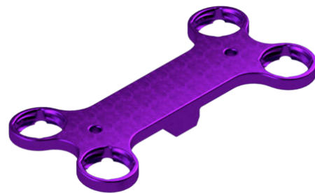
Placa tipo Cunha Bloqueada AV Sistema 3,5 Wedge type plate / Placa de tipo cuña TI003.6000.00X - espaçador de 2,0 mm a 8,0 mm TI003.6000.100 - sem espaçador P TI003.6000.300 - sem espaçador G TI003.6000.200 - sem espaçador M