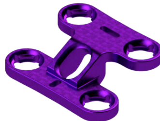
Placa para Fixação de Osteotomia de Calcâneo Plate for fixation of calcaneus osteotomy / Placa para fijación de osteotomía de calcáneo TI003.9001.0XX - passo de 4,0 mm a 12,0 mm