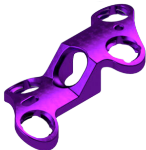
Placa Lapidus Bloqueada AV Sistema 3,5 Lapidus plate / Placa Lapidus TI003.5000.0XX - passo de 0 mm a 10,0 mm