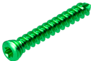
Parafuso Esponjoso Bloqueado Ø3,5 mm Spongy locking screw / Tornillo esponjoso de bloqueo TI001.2035.0XX - comprimento de 14,0 mm a 40,0 mm