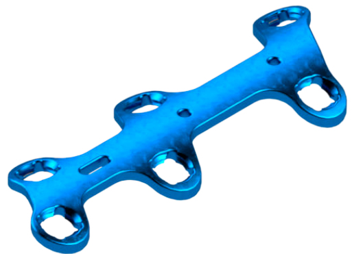
Placa Bloqueada AV de Reconstrução 06 Furos

Reconstruction plate / Placa de reconstrucción