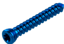
Parafuso Bloqueado TX8 Ø2,7 mm

TI003.4000.0XX - comprimento de 10,0 mm a 30,0 mm