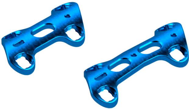
Placa Bloqueada AV para Fixação/Fusão do 1° Metatarso/Falange