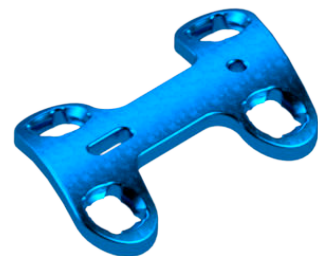
Placa Bloqueada AV Universal Sistema 2,7 para Pé

TI003.3000.00X - espaçador de 0 mm a 8,0 mm