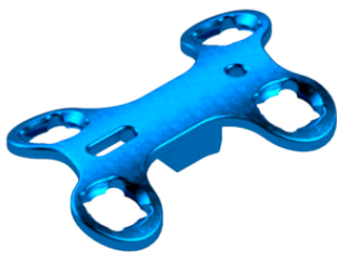
Placa Bloqueada AV tipo Cunha Sistema 2,7

TI003.2000.035 - 06 Furos 35,0 mm TI003.2000.040 - 06 Furos 40,0 mm