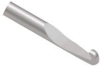
Gancho de Deslocamento M Delta

Utilizado para raspagem e remoção de fragmentos ósseos