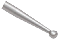
Cureta Esférica M Delta

Utilizado para raspagem e remoção de fragmentos ósseos