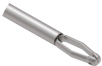
Pinça Coletora M Delta

Utilizado para coleta de tecidos e sutura do disco articular