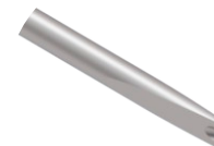
Minescótomo M Delta

Utilizado para guiar o fio durante procedimentos cirúrgicos