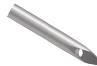
Agulha para Passagem de Fio M Delta

Utilizado para guiar o fio durante procedimentos cirúrgicos