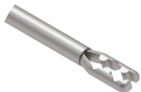
Pinça Auxiliar M Delta

Utilizado para incisões, raspagens e remoções de aderências ósseas