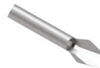
Pinça de Corte M Delta

Utilizado para raspagem das superfícies articulares